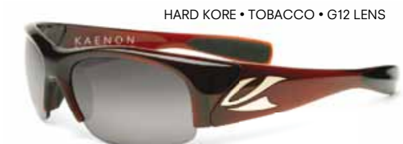
HARD KORE • TOBACCO • G12 LENS