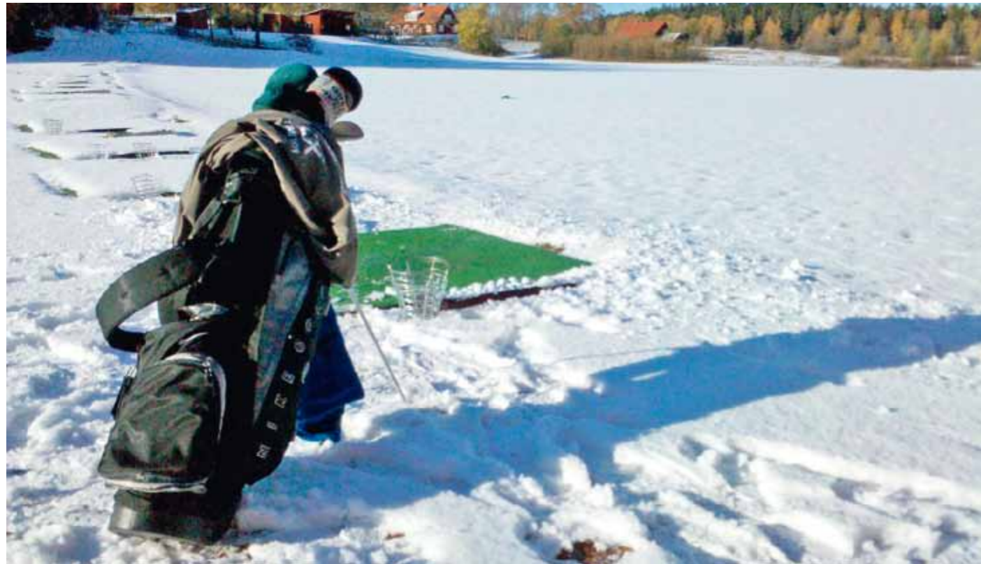
So ein bisschen Schnee wird Sie doch nicht abhalten, oder? Das sind die Momente, die Golfer von Warmduschern unterscheiden...