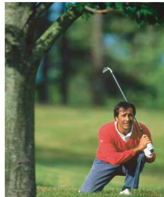
Seve Ballesteros: Kein anderer Golfer spielte je so kreativ und unkonventionell wie der fünffache Major-Sieger.