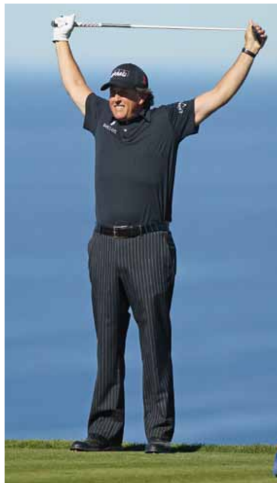
Phil Mickelson glaubt in jeder Situation an sich: Der Ami ist das personalisierte Selbstvertrauen.