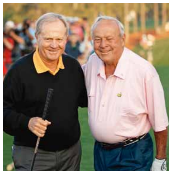
Zwei ganz grosse Golf-Persönlichkeiten: Jack Nicklaus (70) und Arnold Palmer (81) gewannen zusammen 25 Majors.