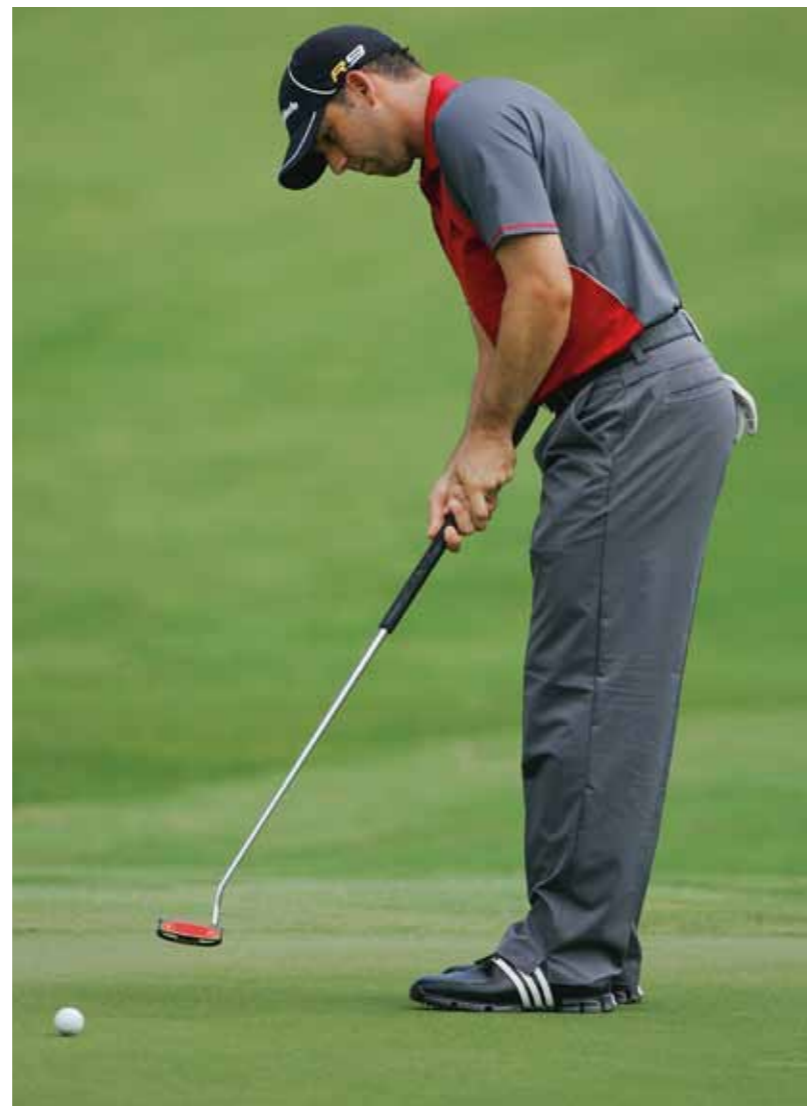
Schauen Sie den Profis am TV zu: Alle haben ihre Routine. Sergio Garcia brachte zu seinen besten Zeit immer 21 Sekunden. Egal, ob mit Putter oder mit Driver.

Und noch etwas: Richtiges Training braucht Geduld, nicht Zeit. Es bringt schon sehr viel, manchmal einfach nur 25 Bälle zu schlagen, diese dafür so intensiv und konzentriert, dass Sie dafür eine halbe Stunde brauchen. Nur durch Training verbessern Sie ihr Wissen, und das Wissen ist Golf wert.